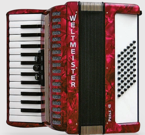
“Weltmeister” Perle colour red-perloid 26/48/11/3